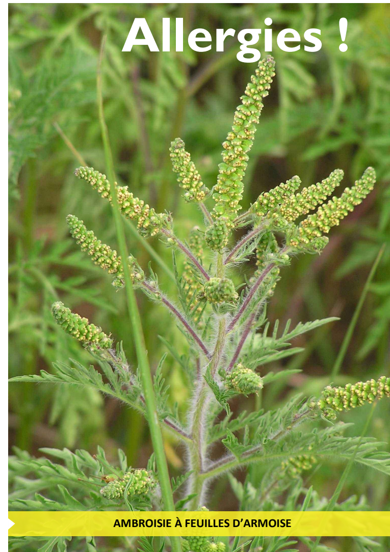
AMBROISIE À FEUILLES D'ARMOISE